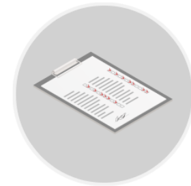
Reporte de salud

Puede llevar consigo su desinfectante de manos personal de hasta 100 ml.