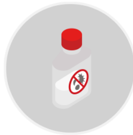
Alcohol en gel

Como parte de las precauciones de salud, no se ofrecerán productos textiles como almohadas en nuestro avión. Puede traer su almohada o almohada de viaje para el cuello.